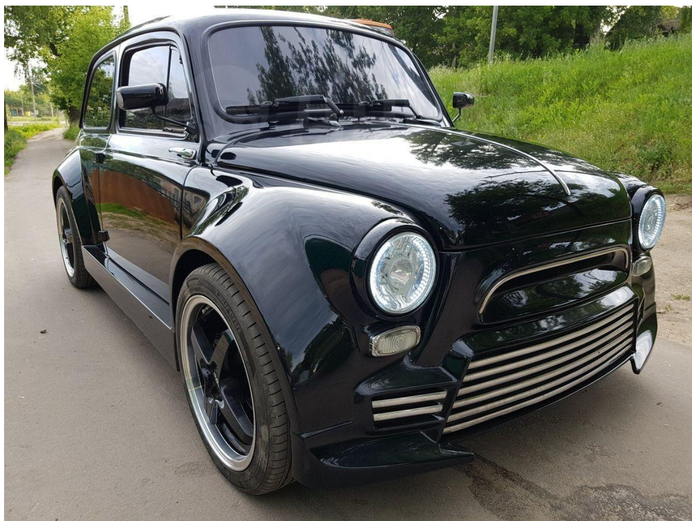
"Запорожец", модель 1967 г.

По стилю изложения книга чем-то неуловимо напоминает фильм Армандо Ианнуччи « Смерть Сталина », о котором мы рассказывали еще пять лет назад: настоящая русская трагикомедия, когда так смешно, что плакать хочется. В ней есть все, что нужно для удачного детектива: описание Москвы начала 1990-х, напомнившей автору довоенный Лондон, открытие героями рынка поддельных сигарет и параллельной реальности, их присутствие при сцене похищения человека из ресторана или расстрела ни в чем не повинных собак, встречи с мафией и сотрудниками КГБ - порой они оказываются «коллегами» и изрекают одинаковые сентенции типа: «Если бы русские могли доверять своему правительству, мы были бы самой богатой страной в мире».