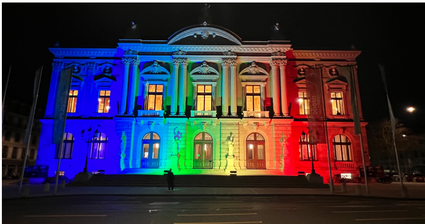
Большой театр Женевы

Культурные мероприятия в Швейцарии, особенно с участием исполнителей из «нашей» части света, традиционно становились темами наших публикаций и естественными местами встреч многих наших читателей. В идеале культура не имеет отношения к политике, но это, как мы знаем, только в идеале, а на деле еще как имеет. И мы с вами сейчас в очередной раз в этом убеждаемся.