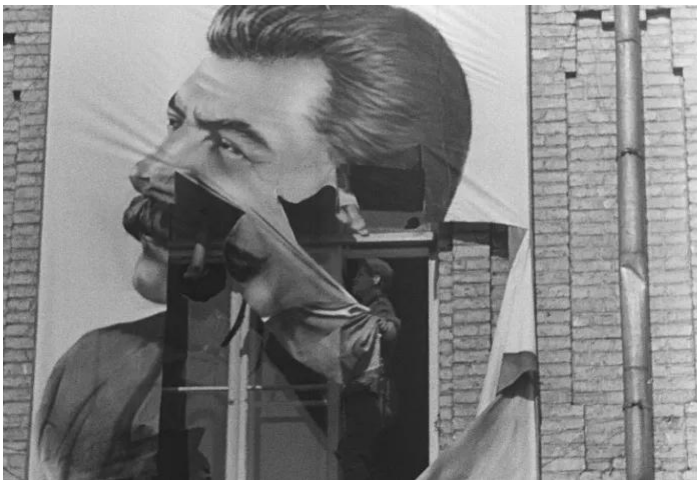
Кадр из фильма Сергея Лозницы "Бабий Яр"

Представляя несколько дней назад программу кинофестиваля Black Movie, мы обратили ваше внимание на активное участие в ней лент из нашей бывшей общей страны – их целых девять. Фестиваль открыла картина режиссера Айжан Касымбек «Огонь» , показывающая жизнь «маленького человека» в современном Казахстане, а сегодня и завтра швейцарская публика сможет окунуться в советское прошлое, которое так хочется забыть, но которое не отпускает.