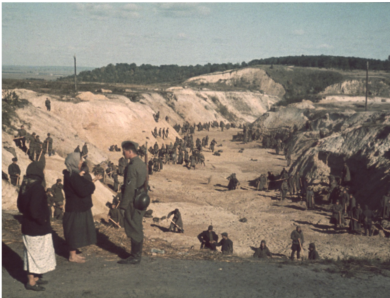
Кадр из фильма Сергея Лозницы "Бабий Яр"

виноват? Евреи! В наказание фашисты решают истребить все еврейское население города, действуя коварно: всем евреям приказано явиться на еврейское кладбище, имея с собой документы, теплые вещи и драгоценности. Они дисциплинированно пришли. Дальнейшее известно: за два дня, 29-30 сентября 1941, в Бабьем Яру был расстрелян 33 771 советский гражданин еврейской национальности. Без малейшего сопротивления остальных советских граждан и даже при содействии некоторых.