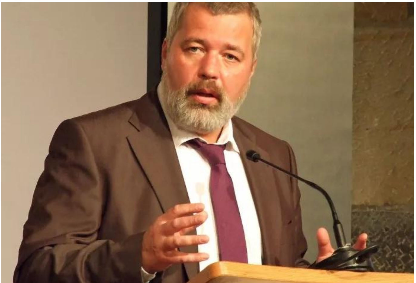
Дмитрий Муратов

8 октября Норвежский Нобелевский комитет в Осло объявил очередных лауреатов Нобелевской премии мира – наверное, самой политизированной из пяти, учреждённых шведским физиком и филантропом Альфредом Нобелем в его завещании, написанном 27 ноября 1895 года в Париже. На этот раз премию поделили два журналиста – филиппинка Мария Ресса и россиянин Дмитрий Муратов.