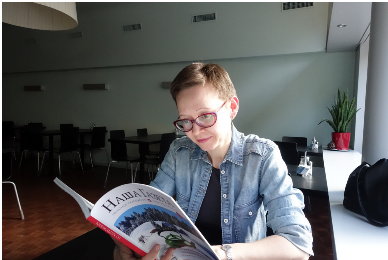
Гузель Яхина

В этом году отмечается столетие Октябрьской революции. Единой оценки этого события в России до сих пор нет. А есть ли она лично у Вас?