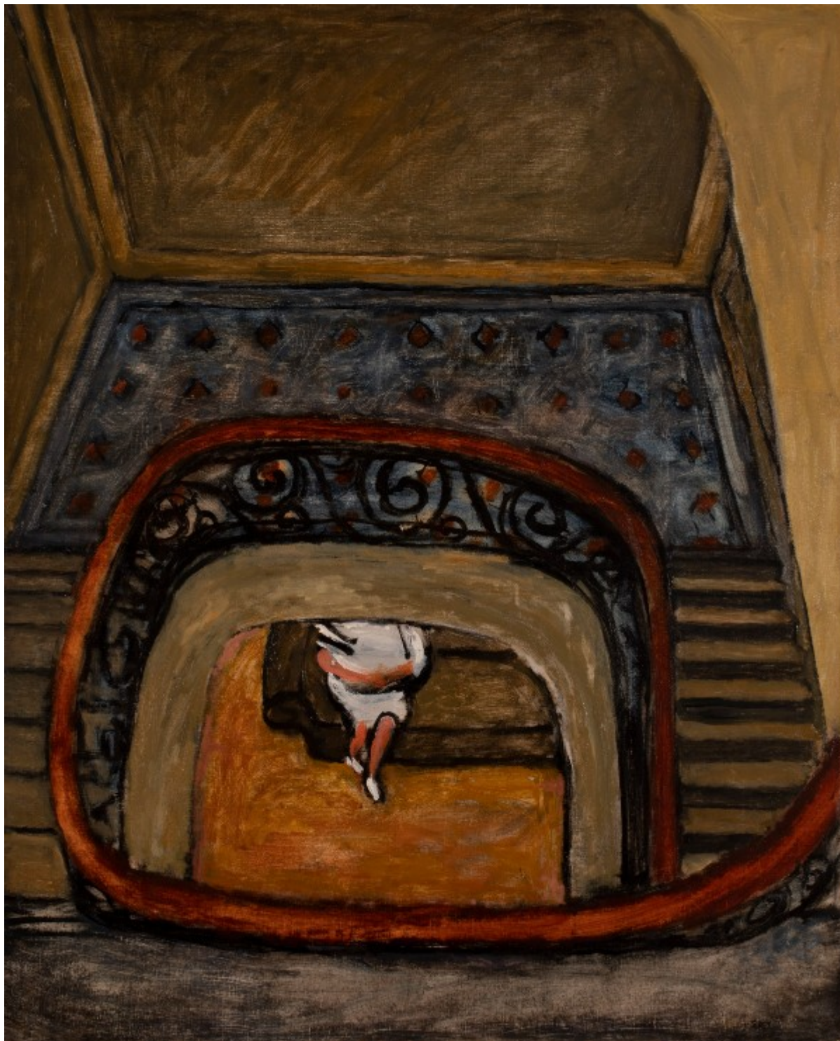
От наброска в дневнике - к картине. Юзеф Чапский. Лестница, 1964 г. Масло, холст. Collection Richard et Barbara Aeschlimann