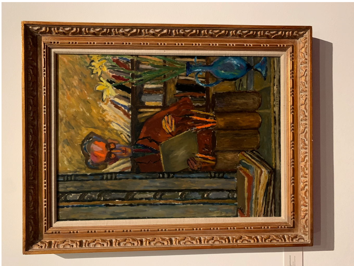
Юзеф Чапский. Автопортрет с дневником. 1951 г., масло, холст. Коллекция Кшиштофа Музала

произошло, главное, произошло. Безусловно, лучше поздно, чем никогда, потому что любой человек, интересующийся живописью, мемуарной литературой, историей Европы 20 века, малоизвестными страницами Второй мировой, историей СССР, русской литературой и философией узнает для себя что-то новое, ведь все эти многочисленные темы переплелись самым непосредственным образом в жизни Юзефа Чапского.