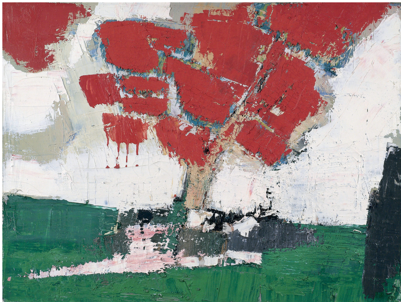
Николя де Сталь. Красное дерево, 1953 г. Collection particulière