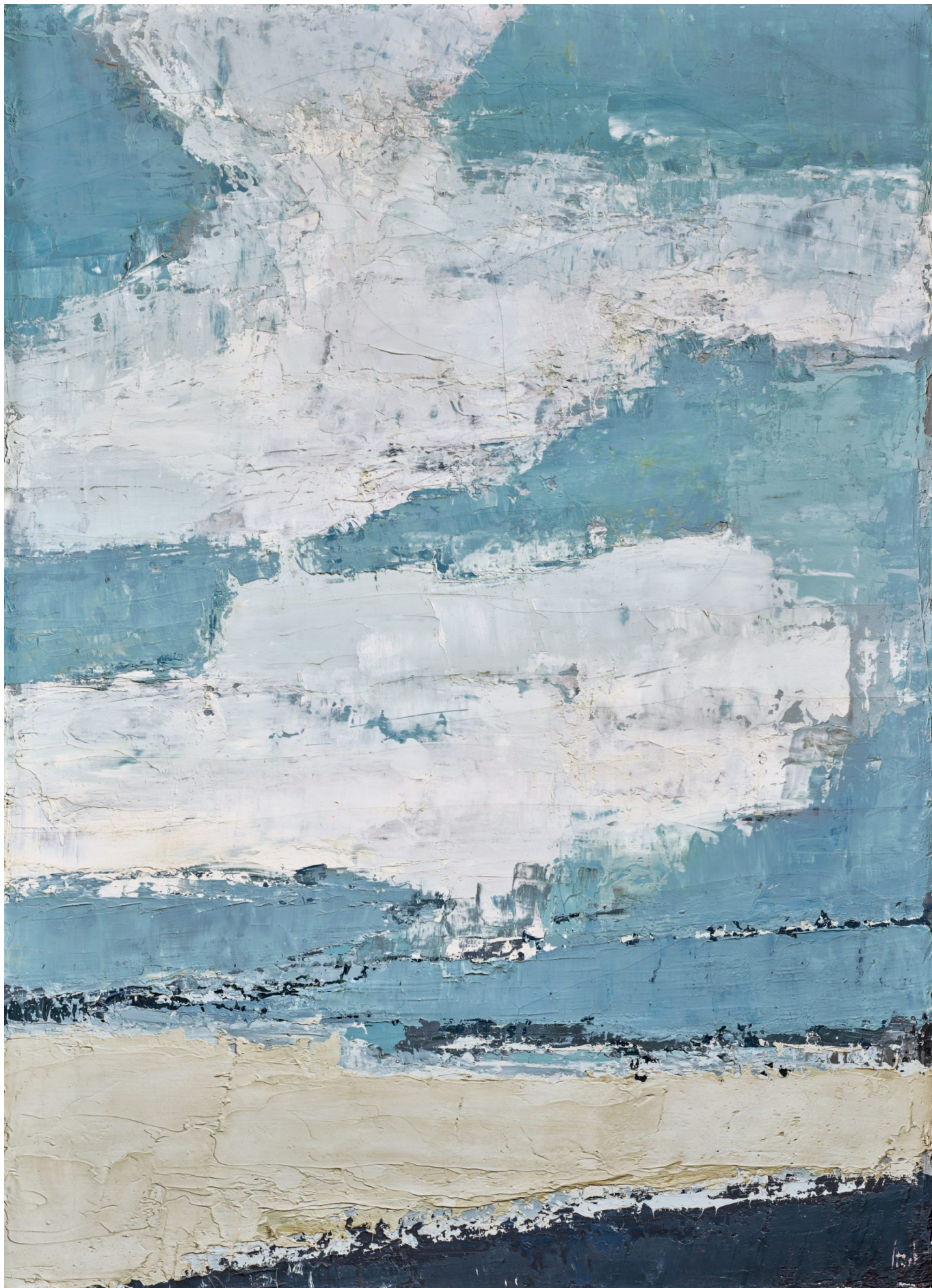
Николя де Сталь. Море и облака, 1953 г. Collection particulière/ courtesy Applicat-Prazan, Paris Photo Thomas Hennocque © 2023, ProLitteris, Zurich