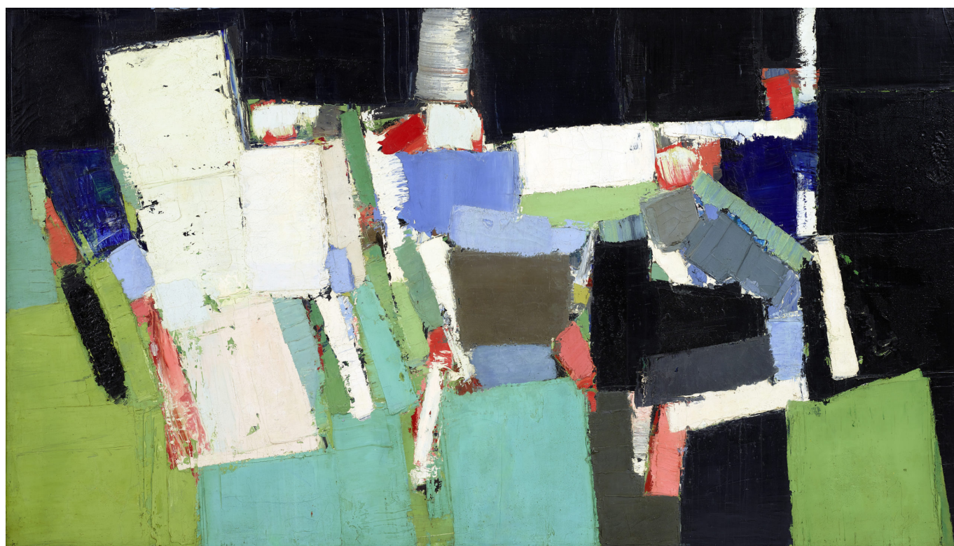
Николя де Сталь. Parc des Princes, 1952 г. Collection particulière