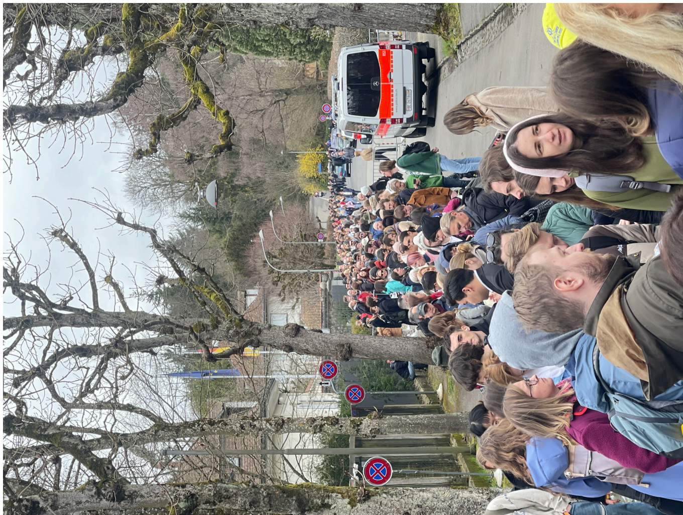
Очередь на избирательном участке в Берне