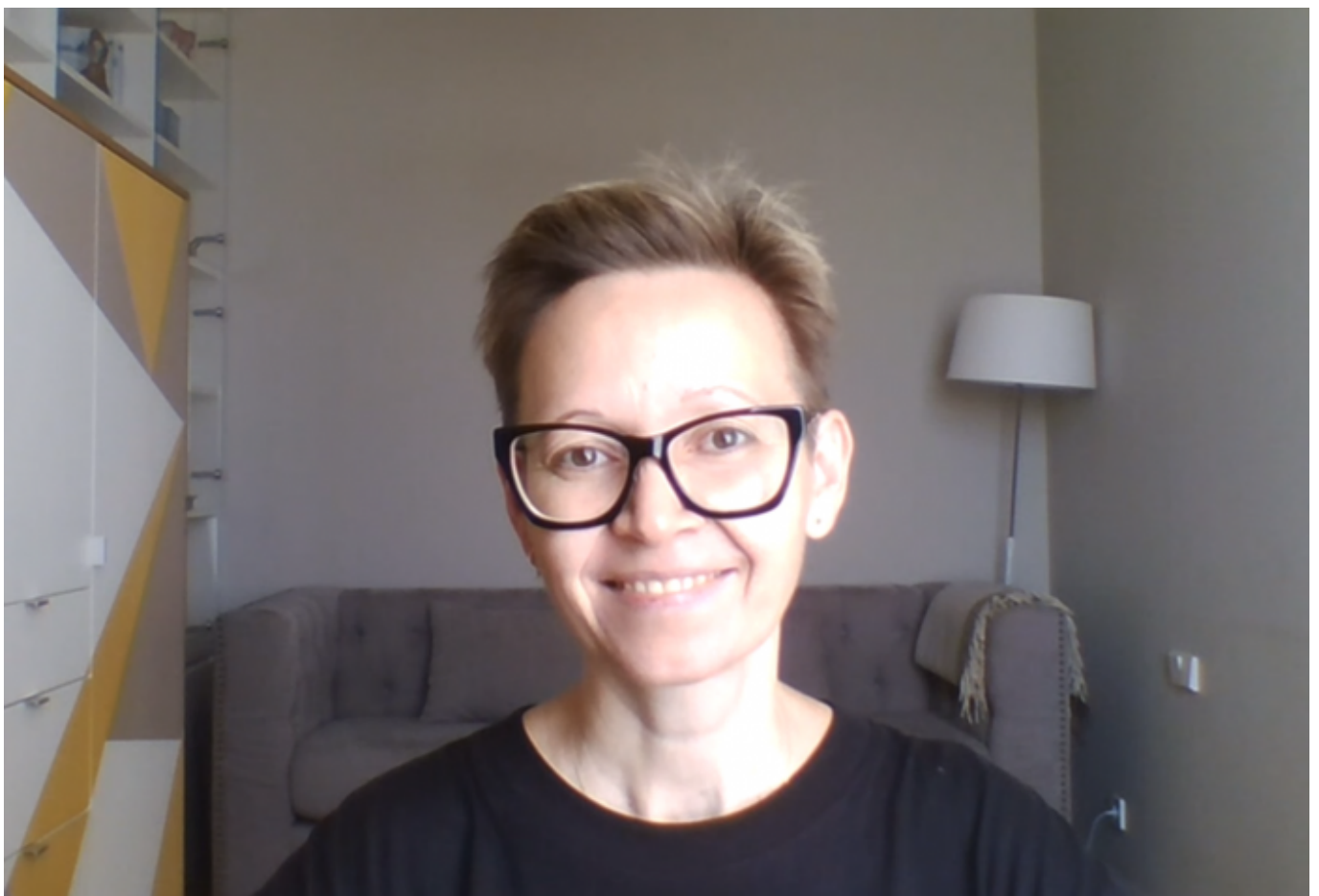
Gouzel Iakhina