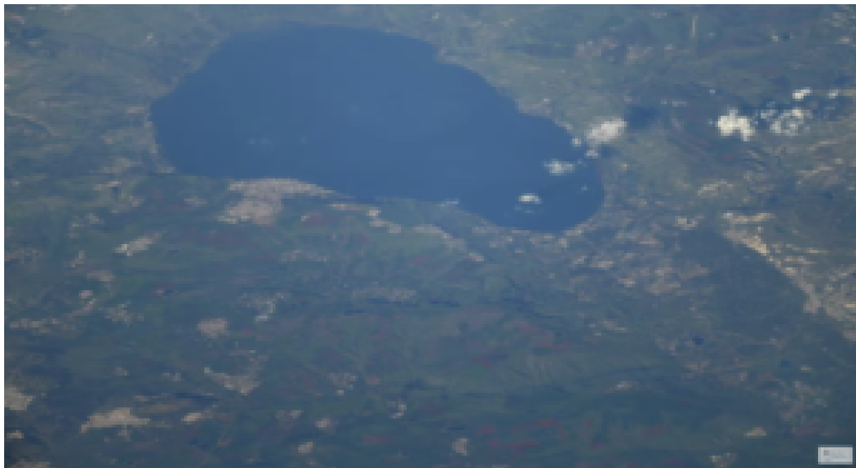
La mer de Galilée vu de l'espace