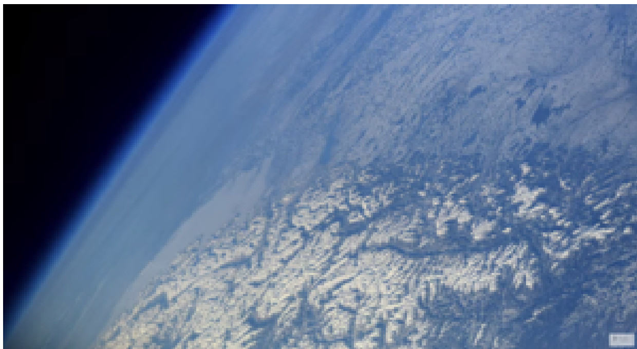
Les Alpes vues de l'espace