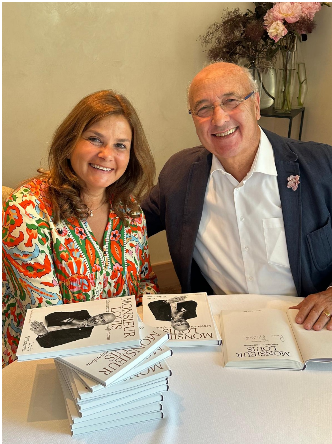
Un moment de gloire "par alliance" pour l'autrice de ses lignes

Source URL: https://www.rusaccent.ch/blogpost/louis-villeneuve-maitre-enchanteur