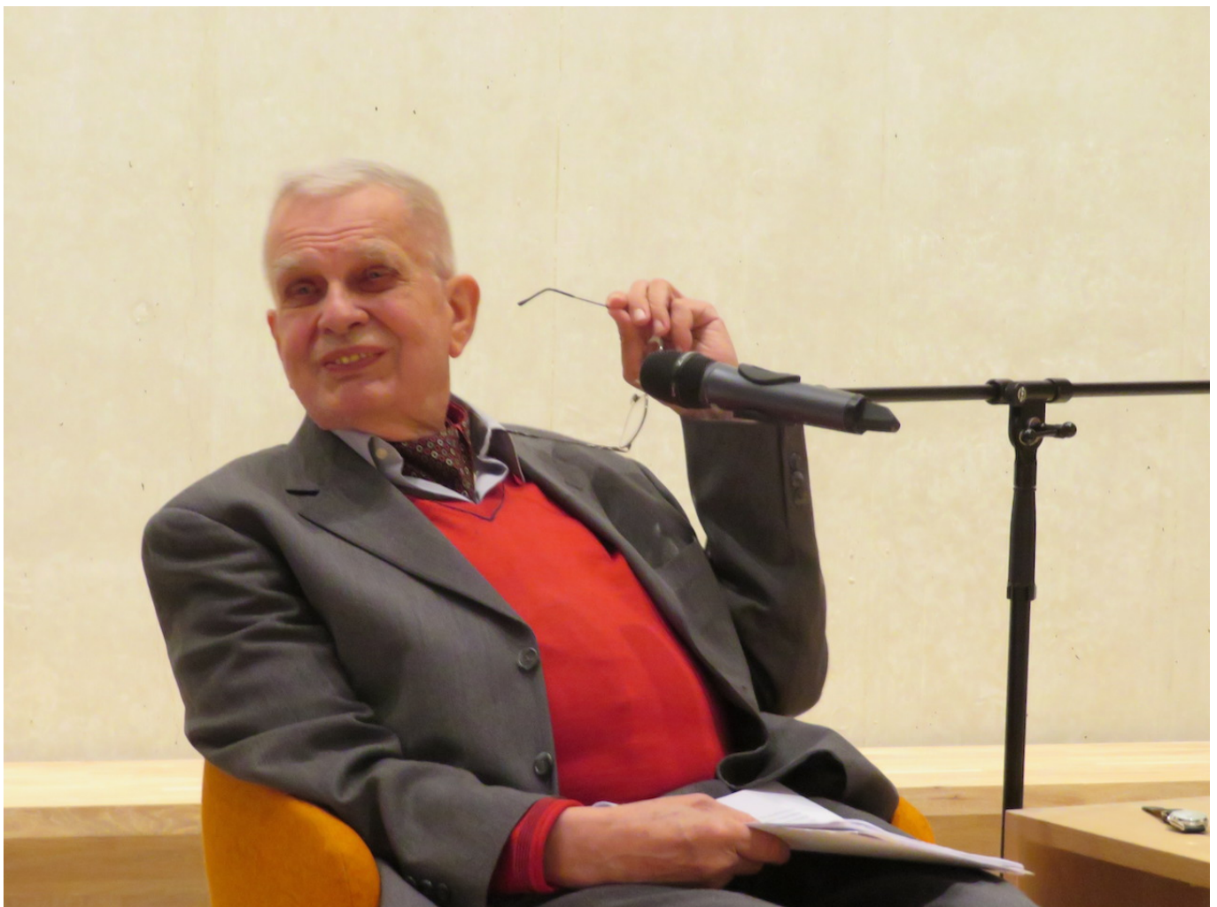
Tomas Venclova en 2018