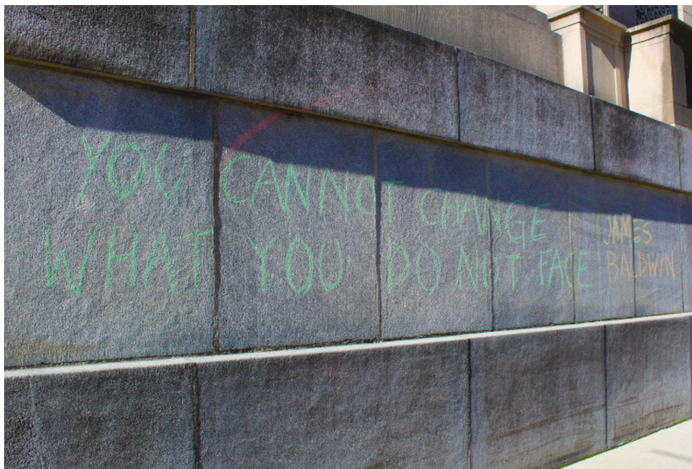
Graffiti avec une citation inexacte de James Baldwin lors d'une manifestation en soutien de George Floyd en Indianapolis, 2020

En mars de cette année, le Service de lutte contre le racisme (SLR) de la Confédération a diffusé un rapport dans lequel il atteste pour la première fois l'existence d'un racisme systémique en Suisse, et ceci dans plusieurs domaines. Cette prise de conscience appelle désormais des actions concrètes et explique peut-être en partie la décision du Kunsthau d'Aarau d'organiser une exposition consacrée au sujet du racisme et construite autour de l'écrivain afro-américain James Baldwin (1924-1987) ; celui-ci est considéré par de nombreux participants du mouvement « Black Lives Matter » comme leur idéologue et leader spirituel – même s'ils ne le citent pas toujours de manière exacte.