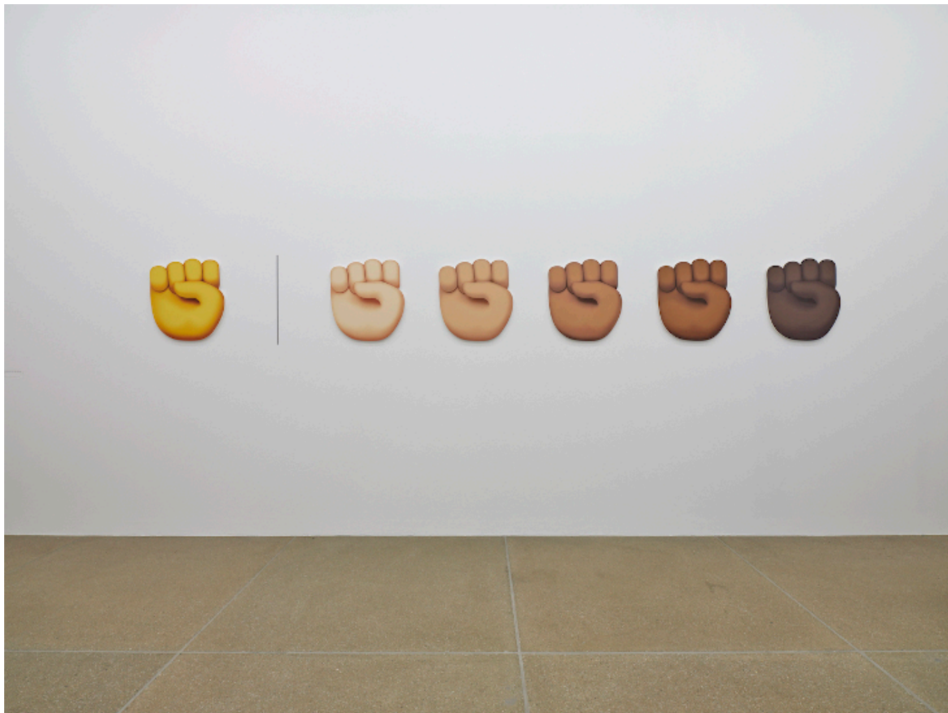
Jonathan Horowitz. Power, 2019. Installation © Jonathan Horowitz

L'histoire se passe en hiver et l'auteur observe, avec un intérêt sincère, comment « au milieu de ce paysage sauvage blanc, hommes, femmes et enfants bougent toute la journée, en portant le linge, le bois, les seaux d'eau ou de lait ; certains font du ski les dimanches après-midi ».