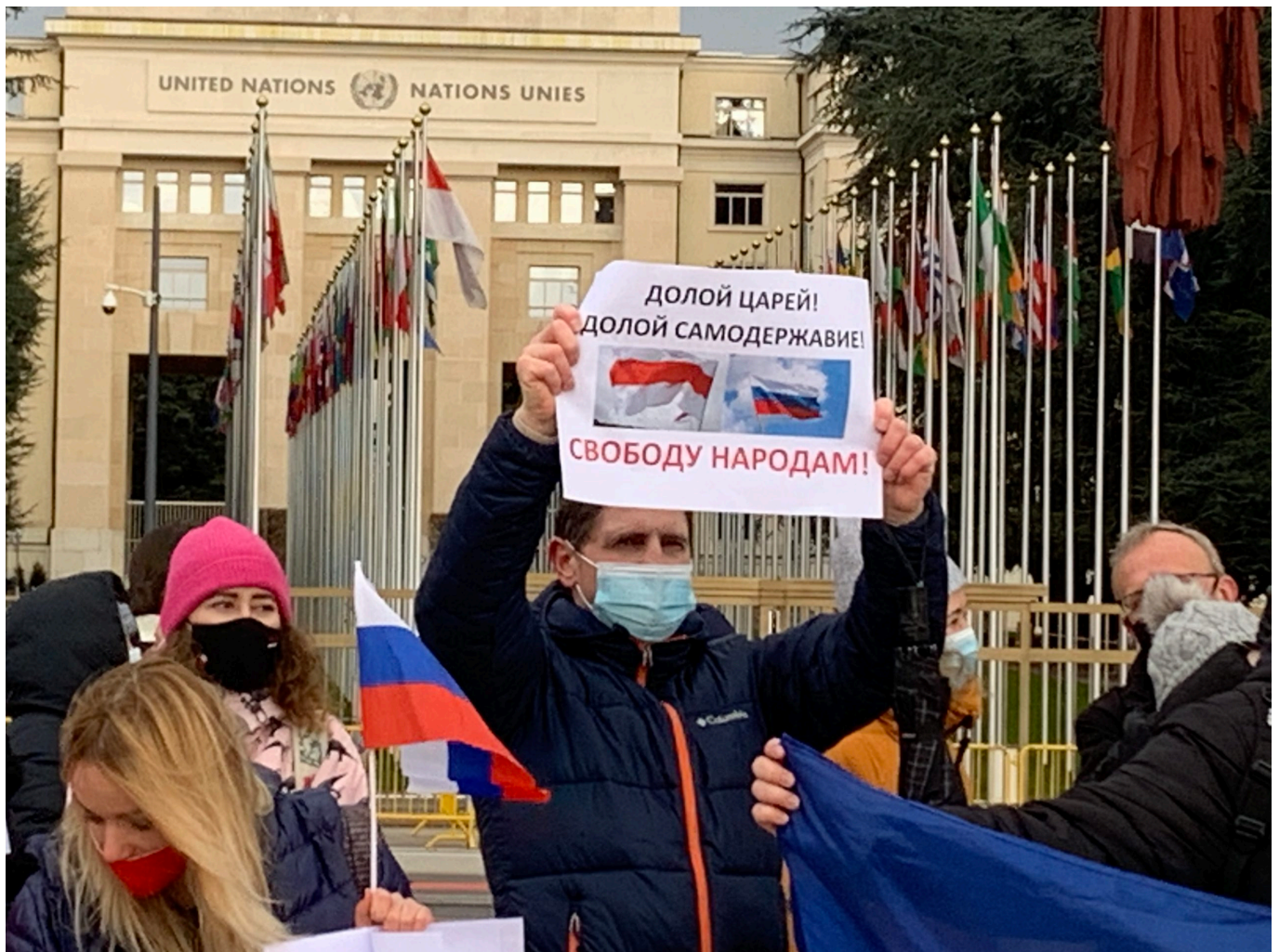
Le 23 janvier 2021, Genève

Dès la création, en 2007, de Nasha Gazeta, je me suis imposée une règle : de ne pas couvrir l'actualité russe ou toute autre du vaste espace postsoviétique, sauf en cas de lien avec la Suisse. J'étais loin d'imaginer, à l'époque, que ces liens, historiques, politiques et culturels, seraient si variés et si nombreux à faire vibrer mes lecteurs. Fidèle à cette règle, je me suis abstenue d'écrire un seul mot dans mon journal à propos de l'opposant russe Alexeï Navalny – jusqu'au 23 janvier. C'est à cette date justement que des manifestations à son soutien se déroulèrent en Suisse. Ce jour-là je me suis rendue à la Place des Nations à