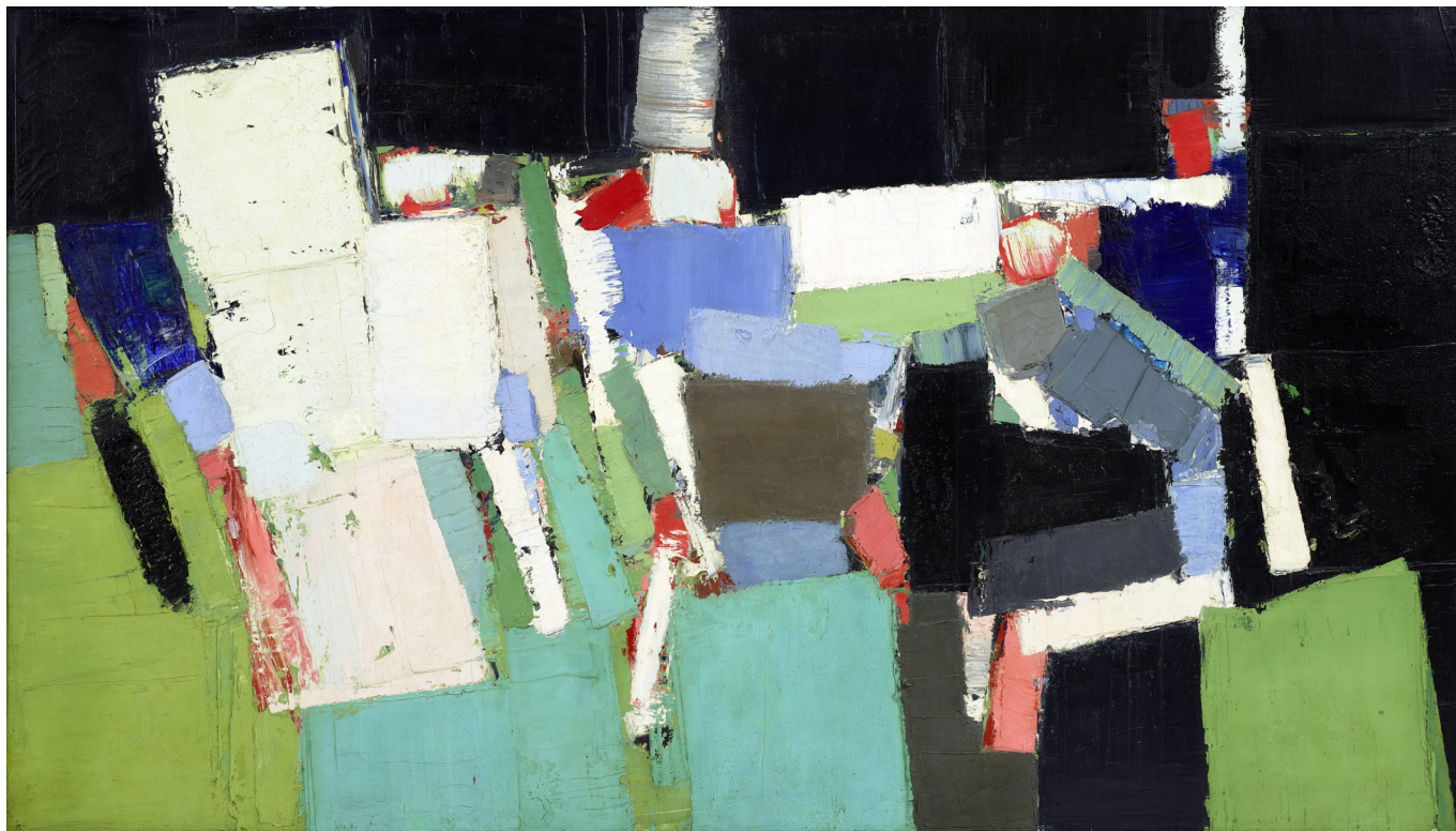
Николя де Сталь. Parc des Princes, 1952 г. Collection particulière