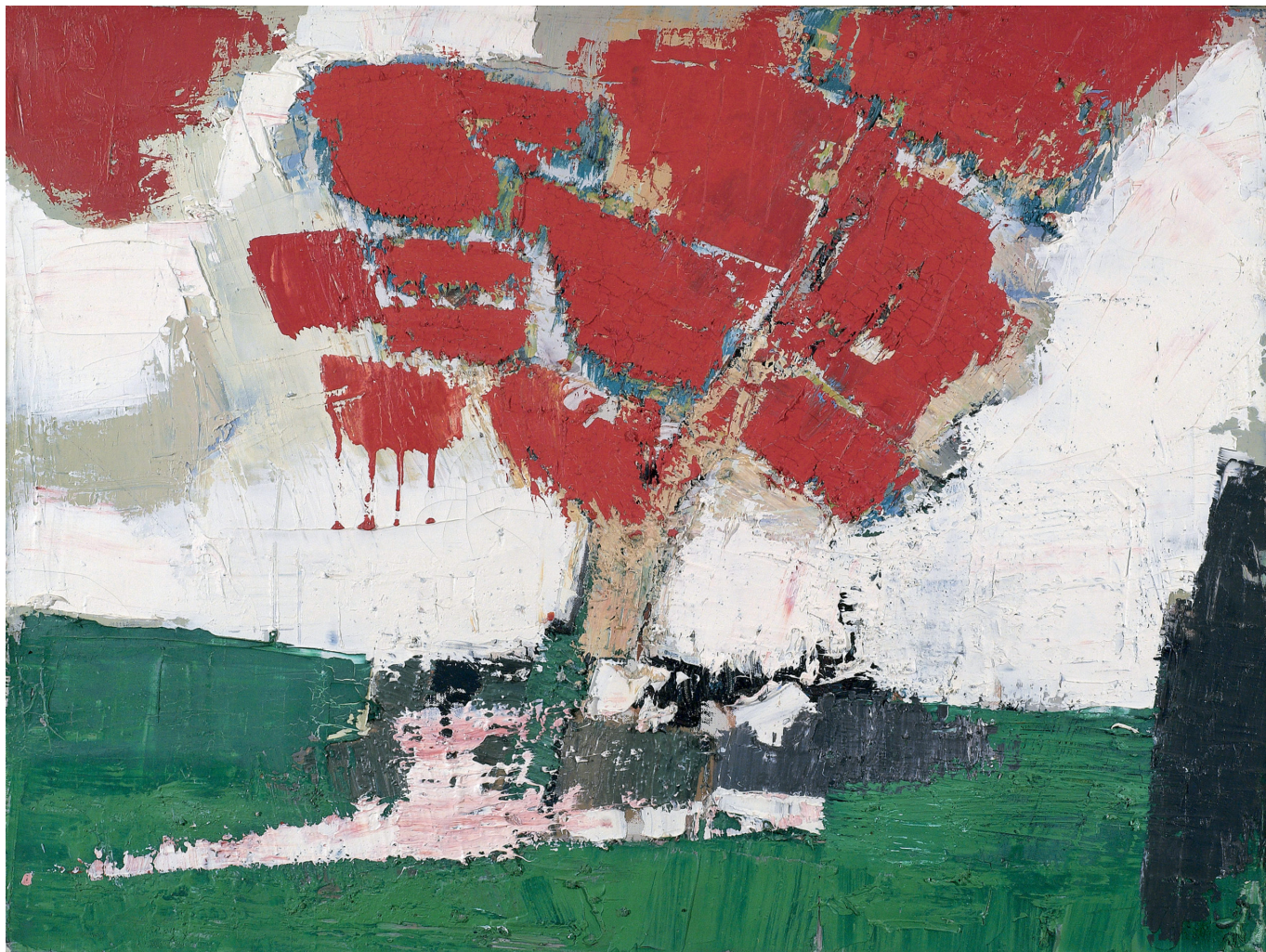
Николя де Сталь. Красное дерево, 1953 г.