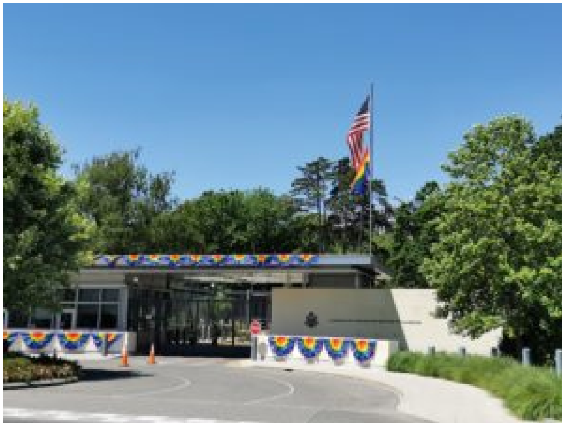
Les américains accueillent leur président

J'ai passé tout la journée d'hier au Centre International de Conférences de Genève (CICG) – seuls les journalistes venus avec les deux présidents ont été admis à assister à leurs conférences de presse respectives, ce qui n'est pas logique, à mes yeux. Vous aussi, vous avez sûrement suivi hier l'actualité de cette journée exceptionnelle, je ne vais donc pas répéter l'essentiel. Juste un détail qui vous a peut-être échappé : l'absence de protocole à l'arrivée du président Poutine, après toute la pompe d'accueil officiel de la veille pour le président Biden. Pourquoi ? Apparemment tel était le souhait de M. Poutine lui-même. Mais pourquoi donc ? Je n'ai pas de réponse à cette question, mais ce détail est peut-être la réponse à Joe Biden qui, la veille du sommet, comptait sur la « prévisibilité » de son interlocuteur.