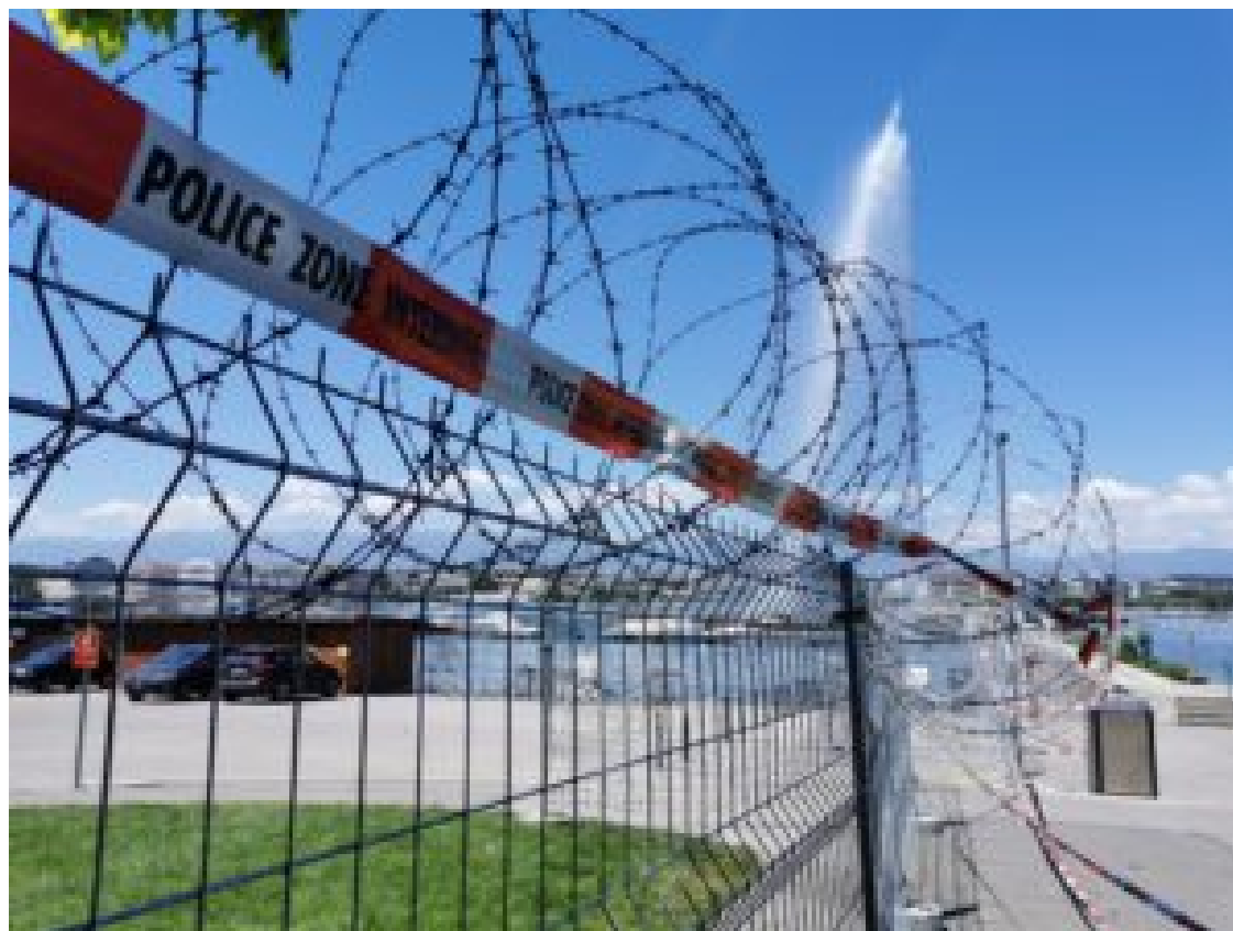
Genève se prépare (Dmitry Tikhonov)

Suisse attache à ce genre d'événements, qu'il n'y ait pas vraiment à Genève un endroit prévu à cet effet. D'où l'incertitude et les rumeurs jusqu'à la dernière minute quant au lieu de la rencontre.