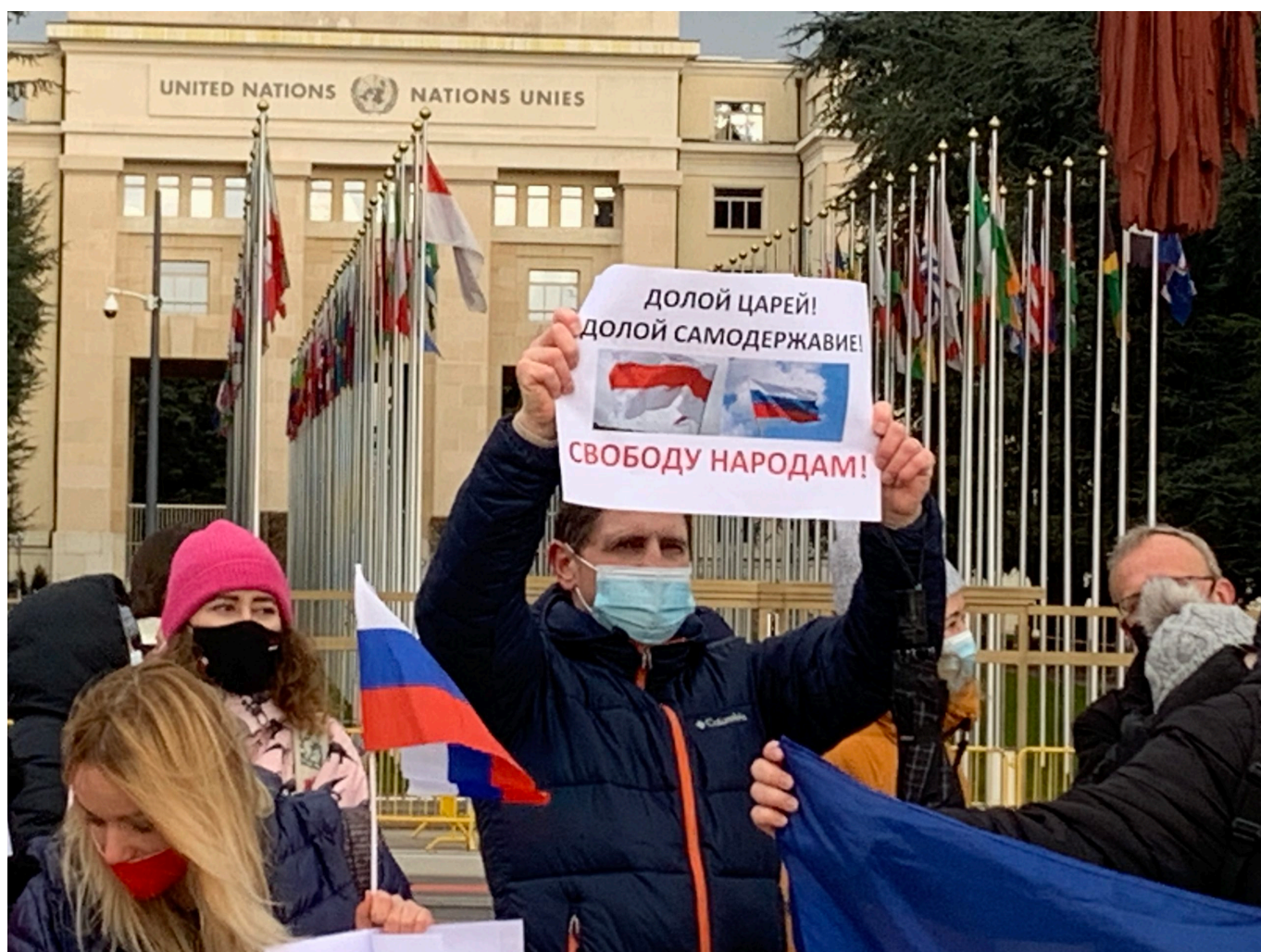
Le 23 janvier 2021, Genève

Dès la création, en 2007, de Nasha Gazeta, je me suis imposée une règle : de ne pas couvrir l'actualité russe ou toute autre du vaste espace postsoviétique, sauf en cas de lien avec la Suisse. J'étais loin d'imaginer, à l'époque, que ces liens, historiques, politiques et culturels, seraient si variés et si nombreux à faire vibrer mes lecteurs. Fidèle à cette règle, je me suis abstenue d'écrire un seul mot dans mon journal à propos de l'opposant russe Alexeï Navalny – jusqu'au 23 janvier. C'est à cette date justement que des manifestations à son soutien se déroulèrent en Suisse. Ce jour-là je me suis rendue à la Place des Nations à