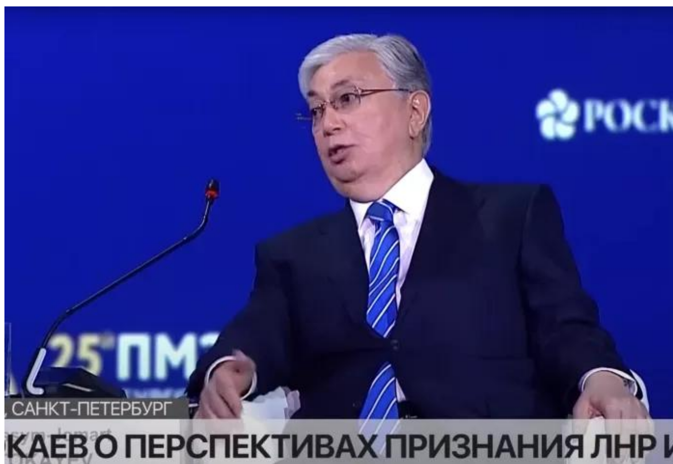
Касым-Жомарт Токаев на ПМЭФ-2022 (скриншот)

В июне 2019 года главный редактор Нашей Газеты приняла участие в работе Петербургского международного экономического форума – тот факт, что наше маленькое независимое издание получило приглашение наряду с солидными китами, вызывал гордость. Однако опубликованный нами репортаж не был лицеприятным.