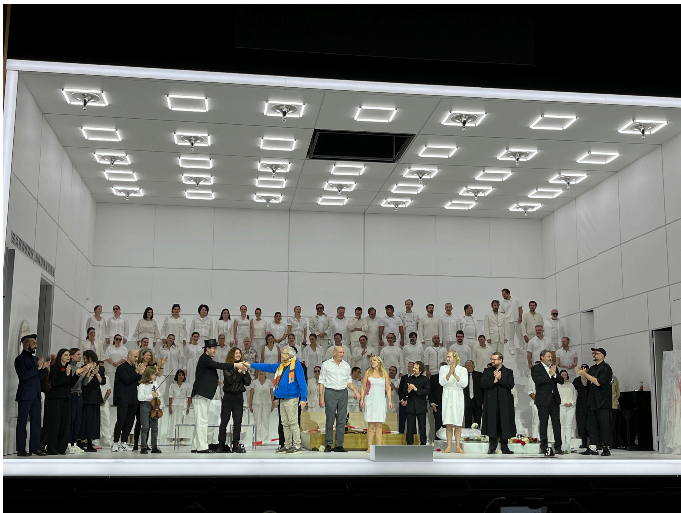
Поклоны и овация в конце спектакля

Идиотство заразительно и заразно. Вот уже и Жена рвет шторы и книги и ходит по нужде прямо на ковер, чем в конце концов выводит из терпения Мужа и Идиота (двух идиотов?). «Тогда мы ее избили, не очень больно, раздели для забавы и избили, хохоча над ее дурацкими титьками, которые резво подпрыгивали, пока мы ее били, но, однако, она все-таки потеряла сознание – и титьки стали совсем уж дурацкими, и мы даже всплакнули над их бесповоротной глупостью», - читали зрители, запрокинув головы. Интересно, испытывают ли они сострадание и припоминают ли, что именно за его нехватку и расплачивается идиот «Я»?