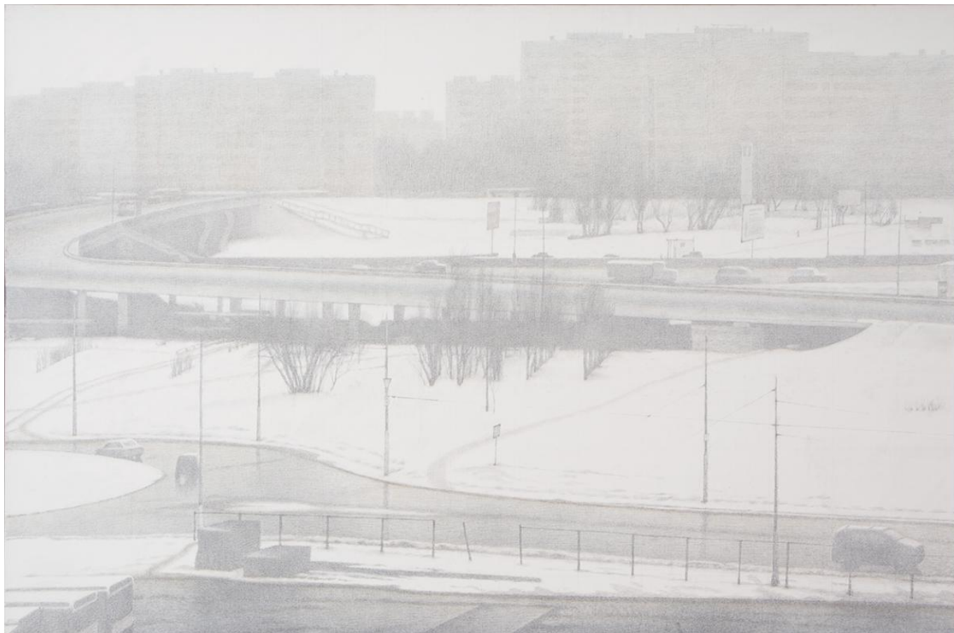
Erik Boulatov. « Matin à Moscou ». Toile, crayon. 2014