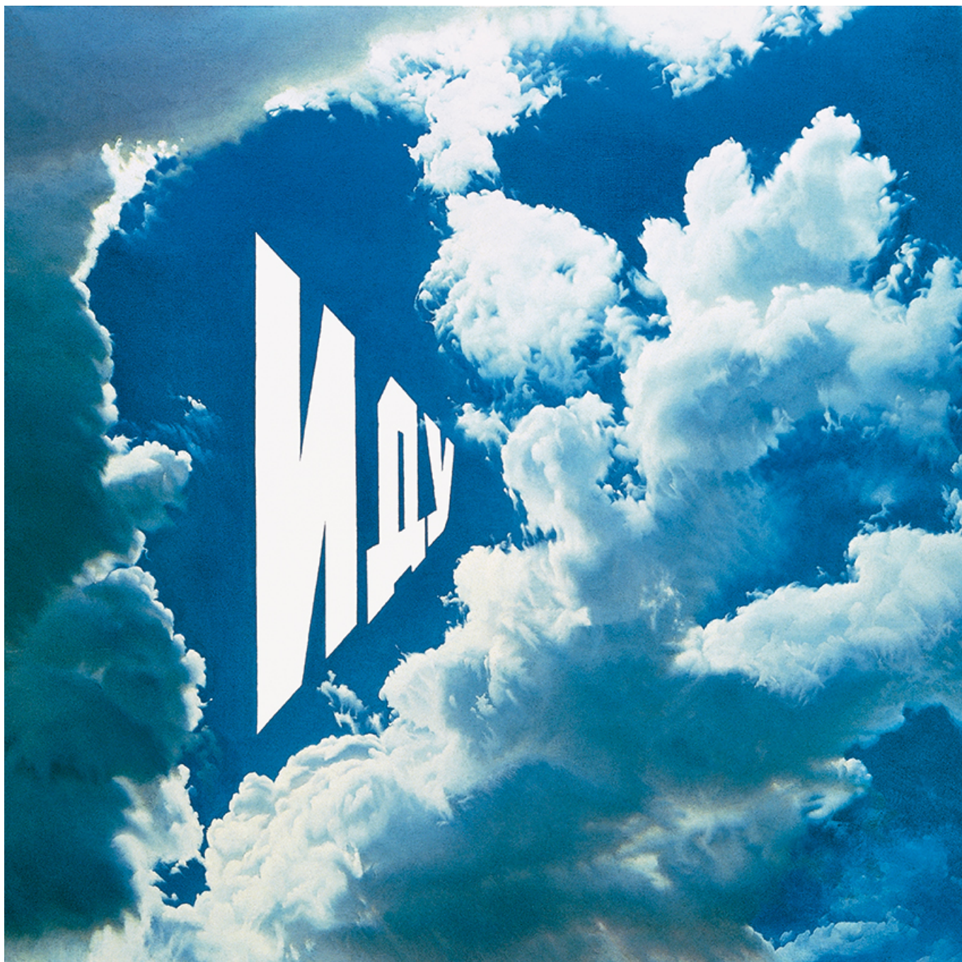
Erik Boulatov. « J'y vais », Huile, toile. 1975

Je travaille avec le matériau que me donne la vie. Et la vie change.