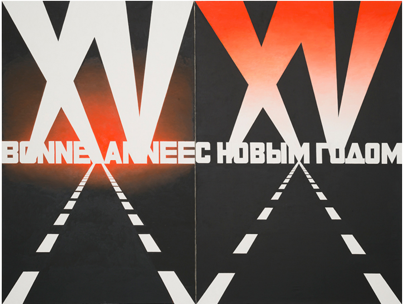
Erik Boulatov. « Bonne année - S Novym godom ». Huile, toile. 2015

agit comme citoyen, comme simple personne vivant dans ce pays et ayant le droit de s'exprimer, il doit comprendre qu'il devra assumer toute la responsabilité civile. Et ne pas crier ensuite qu'on lui bâillonne la bouche, ne pas se cacher derrière l'art. Un acte citoyen doit rester un acte citoyen et être perçu comme tel.