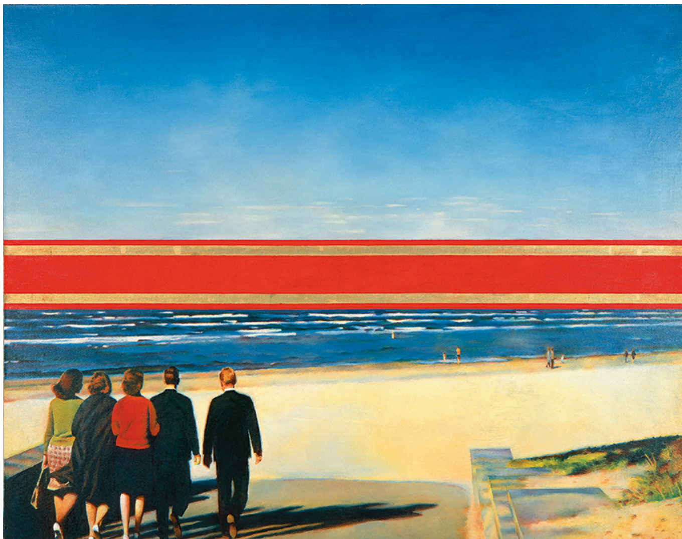
Erik Boulatov. « Horizon », 1971-1972

souffrance terrible. Et dans les petits dessins, ça va plus vite, même s'il faut en faire beaucoup jusqu'au moment où je vois : voilà, ça y est, je reconnais ! À ce moment-là, je peux commencer la grande toile. D'ailleurs, les grands tableaux, je les peins assez vite. Donc si je n'en fais pas davantage, ce n'est pas parce que je ne fais rien... Je fais de mon mieux !