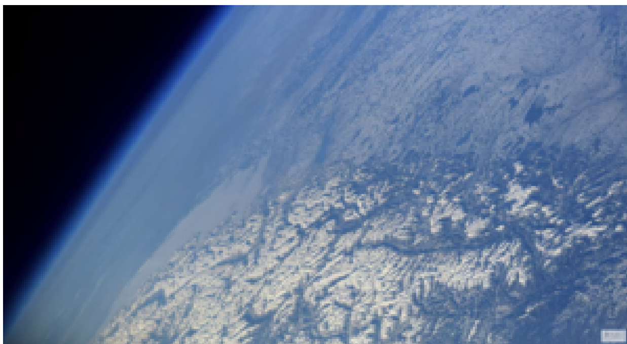
Les Alpes vues de l'espace