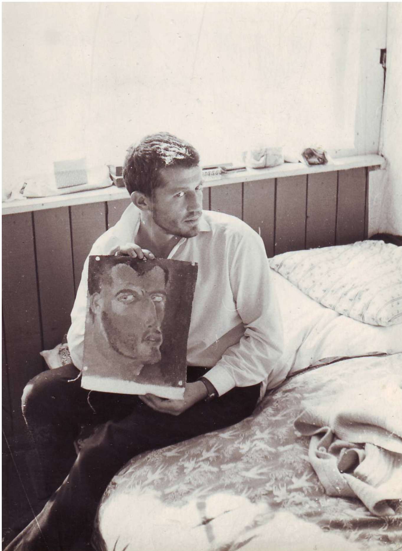
Леонид Аронзон с автопортретом. 1966-67 гг.

Я вычитала, что 12 октября 2019 года, то есть в год его 80-летия и в канун